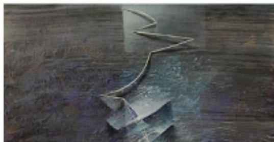
Galeria FORUM • Wydział Sztuk Pięknych UMK • ul. Sienkiewicza 30/32 • Toruń